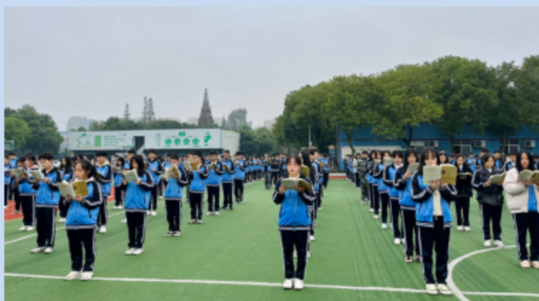
图4.2 “日有所诵”每日全校晨读活动