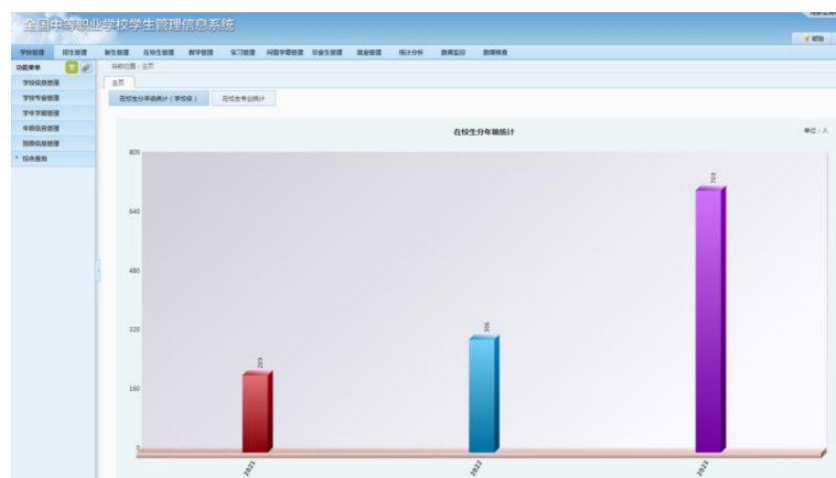
上图：2023 年 12 月 11 日学籍系统截图

截至目前，经过全校戮力同心，学校已招收新生 709 名，在校学生达到 1224 名，至今新生人数仍在不断增加之中。对照达标进度与要求，学校如期完成“空小散弱”整改工作。我们深知未来的路还很长，路漫漫其修远兮，吾将上下而求索。我们将始终不忘初心，牢记“立德树人”根本任务，不断夯实“为党育人、为国育才”阵地，为了学生、教师、学校“三个发展”，努力将学校办出特色，办成品牌，为双流区、成都市经济建设和发展赋能。