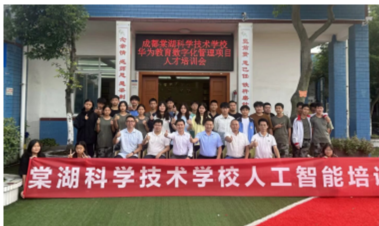
图6.1 华为教育数字化管理项目人才培训会