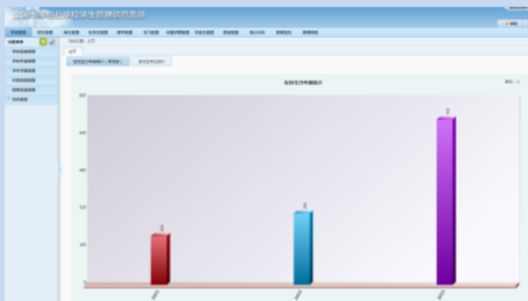
图7.2 2023年12月11日学籍系统截图

截至目前，经过全校戮力同心，学校已招收新生709名，在校学生达到1224名。对照达标进度与要求，学校如期完成“空小散弱”整改工作。我们深知未来的路还很长，路漫漫其修远兮，吾将上下而求索。我们将始终不忘初心，牢记“立德树人”根本任务，不断夯实“为党育人、为国育才”阵地，为了学生、教师、学校“三个发展”，努力将学校办出特色，办成品牌，为双流区、成都市经济建设和发展赋能。