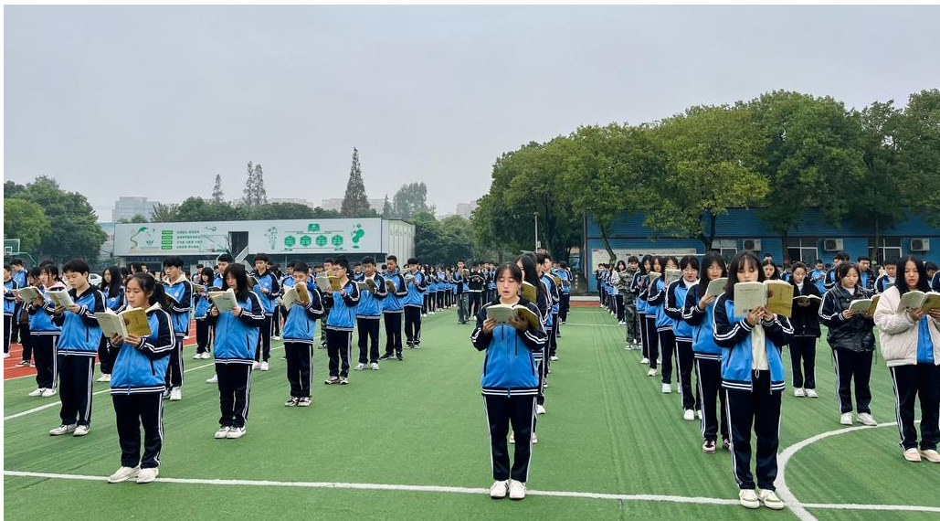
上图：“日有所诵”每日全校晨读活动