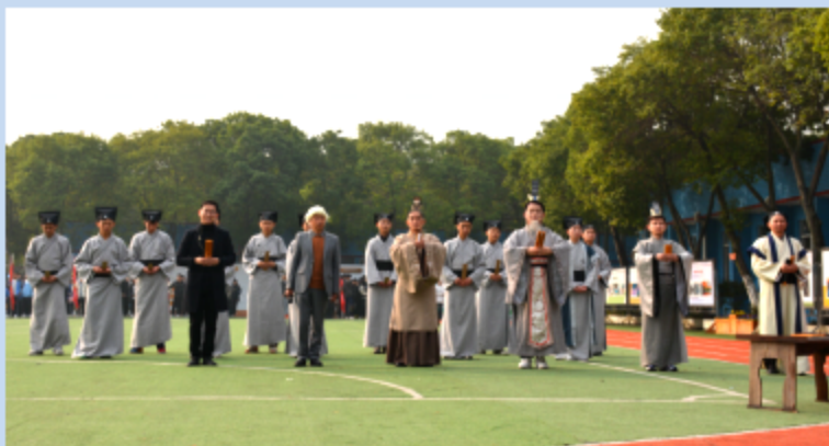
图4.1 校园文化艺术节国学经典节目

全体语文教师参与，全校选拔国学经典诵读优秀学生，在舞台上弘扬中国传统文化，展示学期国学经典诵读成果。