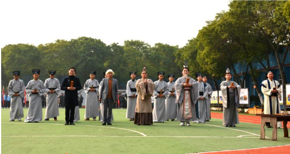
上图：校园文化艺术节国学经典节目

全体语文教师参与，全校选拔国学经典诵读优秀学生，在舞台上弘扬中国传统文化，展示学期国学经典诵读成果。