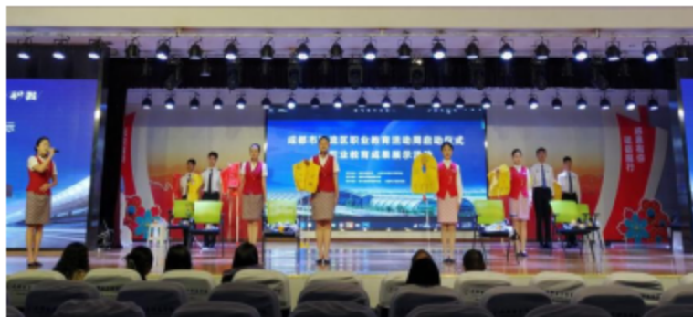
图2.6 航空服务专业学生进行客舱安全演示

种教学模式；同时，教师在课堂上普遍采用小组学习、合作学习和自主学习等多种教学方法，因材施教，学生学习能力得到逐步提升，教学效果明显提高。