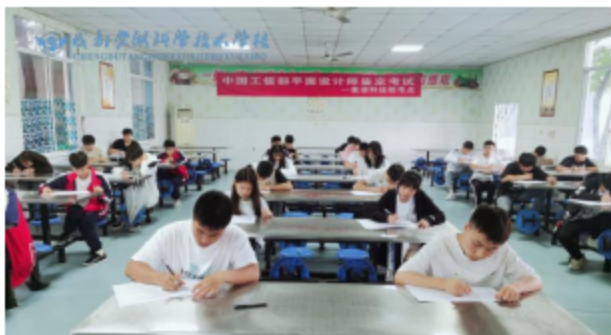
图2.3 计算机专业:平面设计师笔试考试