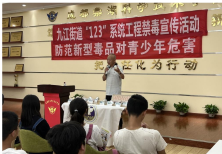
图2.1 九江街道进校园禁毒宣传活动

八是构建德育网络，增强德育合力，通过校讯通、家长微信群等，加强与家长的联系和沟通，共同做好学生思想教育和稳定工作。