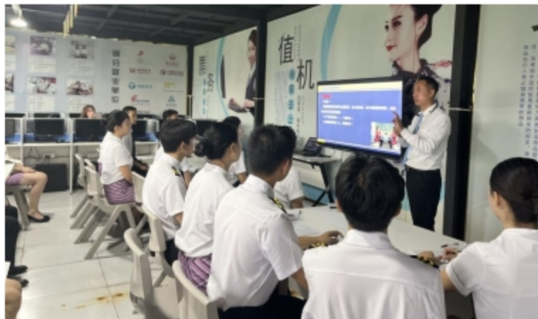
图2.4 航空服务专业课上课中