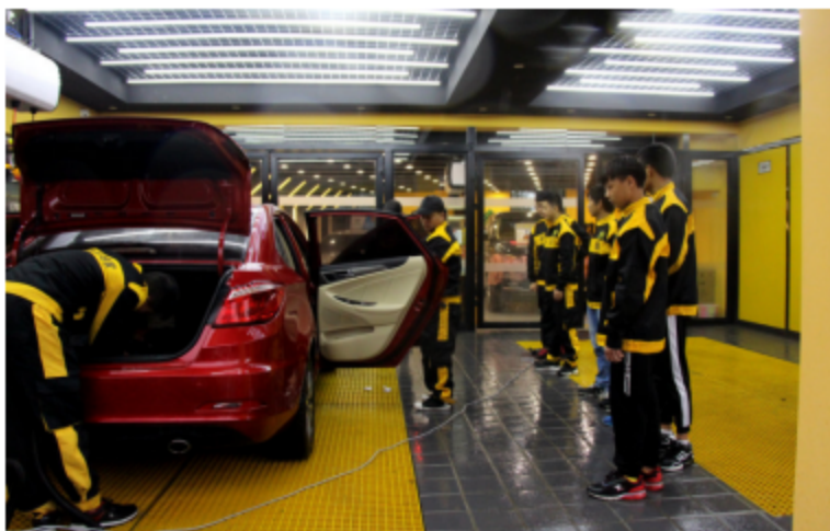
图2.5 20级汽车运用与维修专业学生实习

顶岗实习按照《四川省成都市职业学校学生顶岗实习管理规程》、《中等专业学校学生实习管理条例》精神，原则上整班安排，统一管理。让学生树立顶岗即上岗、实习即就业的职业意识，在就业安排过程中主要以学校推荐、个人灵活相结合的方式。