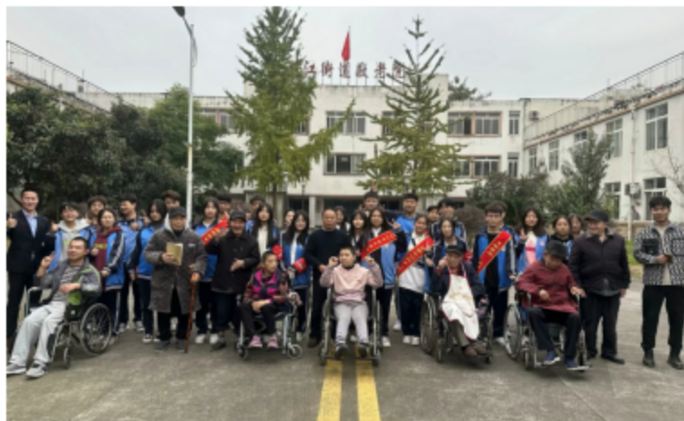
图3.1 为学校志愿者服务队进行敬老院关爱老人服务后合影